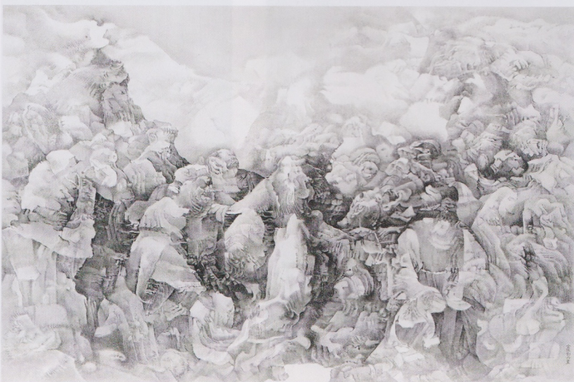
Eskenazi: 劉丹〈縐褶被重新確定〉，紙本水墨，200×301公分。