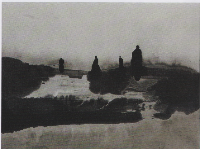
Aktis Gallery: 高行健2013年作〈遊行者〉，紙本水墨，81×110公分。 圖/Aktis Gallery。