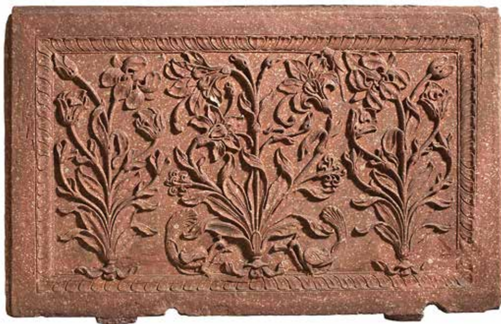
A SINISTRA, DALL'ALTO: placca in arenaria, India Moghul, XVII secolo; vassoio con intarsi in argento, India, primo '700 (da Simon Ray).

in St. James's organizza la mostra "Oggetti d'arte indiana e islamica", in corso fino al 30 novembre , con recenti acquisizioni, come, ad esempio, un piatto in ceramica con una decorazione a tema floreale, Damasco, fine XVI secolo, una elaborata collana con zaffiri bianchi e rubini, India meridionale, XIX secolo, e una piastrella Iznick, Turchia, del 1550 circa. ( simonray.com ).